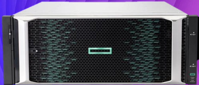
HPE Alletra 5000