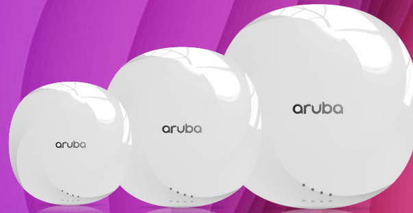
HPE Aruba 6xx Series