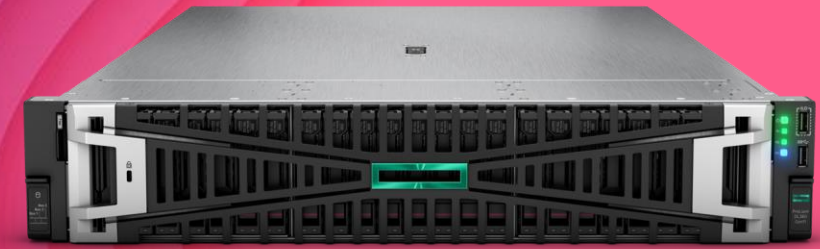
HPE ProLiant Gen11