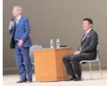
大塚名誉会長、林会長対談 (2023年4月)