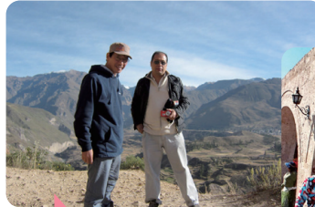
コルカ渓谷・ タバイにて