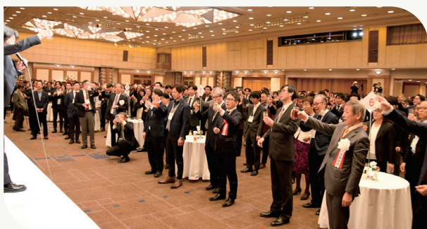
乾杯し業界発展を誓い合う参加者

林会長は、会場で振る舞われた日本酒「十四代」を紹介。辛口の日本酒が主流だった中、十四代のフルーティーな味わいが注目を集めると、各社が追従してトレンドを形成した。「今や世界のマーケットで日本酒が売られる、まさに新たな市場をつくった一例だ」と説明した。挨拶の結びではこれになぞらえ、「（SCS評価制度によって）私たちの手で大きなマーケットを作るんだということを、今年のスタートにおける景気のいい話としたい」と述べた。