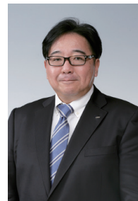
一般社団法人 日本コンピュータシステム販売店協会